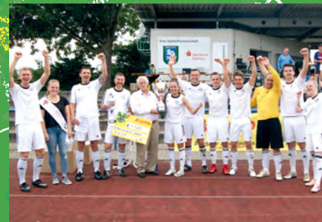
2018 - Fußballverband Rheinland