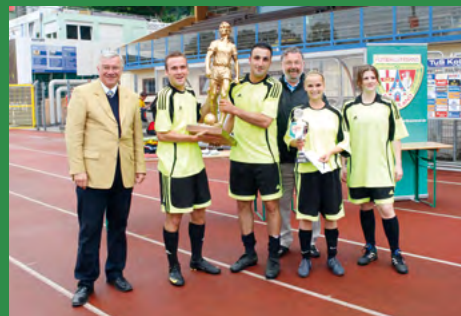
2010 - Creditreform