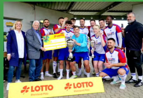
2024 - Intersport Krumholz