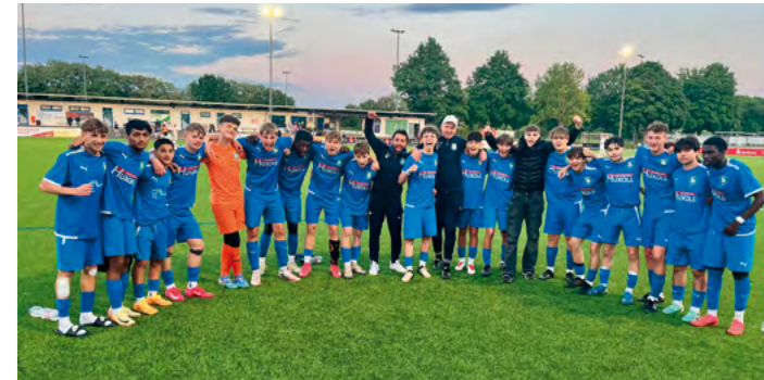
Die Erleichterung steht den Jungs der B2 ins Gesicht geschrieben: Klasseerhalt gesichert.

aber eben auch sieben Niederlagen – das Ergebnis kann sich trotzdem sehen lassen. Im Rheinlandpokal war erst im Halbfinale gegen den späteren Pokalsieger TuS Koblenz Endstation. Trainer Markus Mannebach und Co-Trainer Andreas Mattler formten eine eingeschworene Truppe, die sportlich und menschlich zusammengewachsen ist – eine echte Einheit mit Perspektive auch für die anstehende A-Jugend.