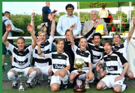
2011 - Debeka