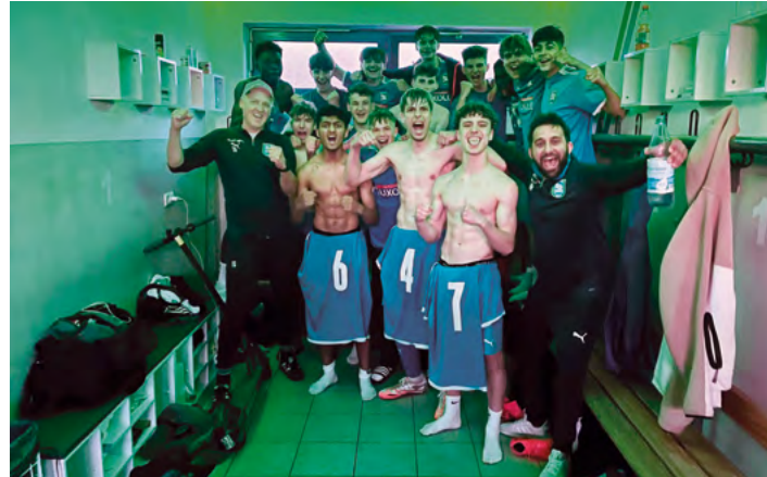
Nicht nur Meisterschaften dürfen gefeiert werden! Unsere U16 in Siegerpose nach dem Spiel gegen den Tabellenführer.

Die Saison 2024/25 hat wieder einmal gezeigt, was die Jugendarbeit der SG 2000 ausmacht: Einsatz, Entwicklung, Teamgeist – und eine riesige Portion Leidenschaft. Unsere Jugendabteilung war in allen Altersklassen aktiv, von der A-Jugend bis zu den Bambini. Wir haben Siege gefeiert, Rückschläge verarbeitet und viele kleine Erfolgsgeschichten erlebt. Zeit für einen Blick zurück auf eine spannende Spielzeit.