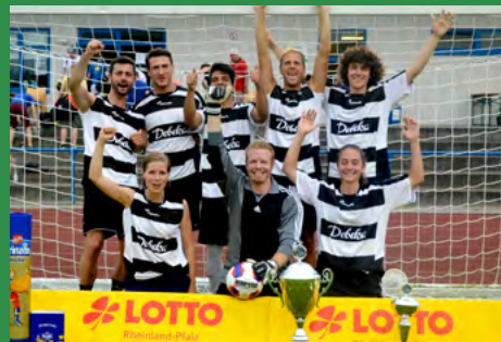
2015 - Debeka