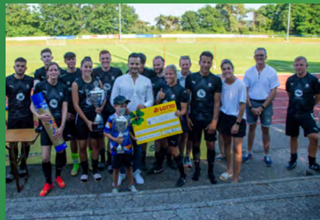
2023 - Ad optimum