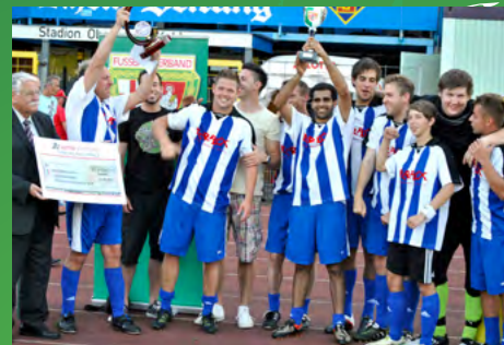
2012 - Perplex