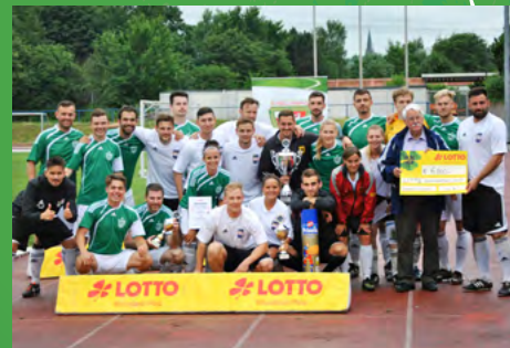
2017 - Bundeswehr