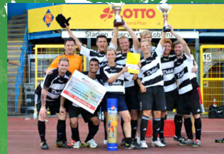
2014 - Debeka