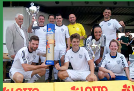
2022 - Fußballverband Rheinland