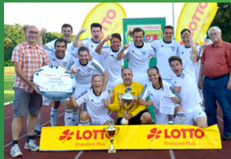
2016 - Fußballverband Rheinland