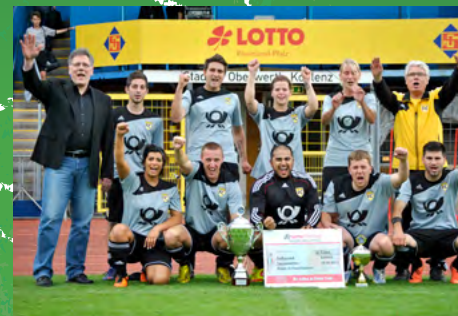
2013 - Deutsche Post