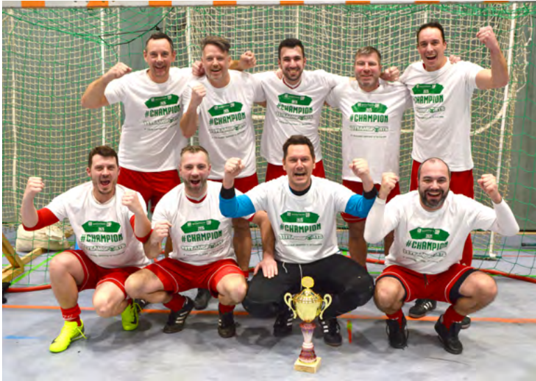
▲ Die Alten Herren des TuS Kettig gewannen zum dritten Mal in der langen Turnierhistorie am Freitagabend. Aus STADTJournal-Sicht darf erwähnt sein, dass einige Mülheim-Kärlicher auf dem Siegerfoto zu sehen sind.