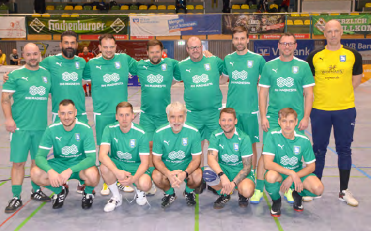
▲ Die Alten Herren der SG 2000 traten in neuen Trikots – Dank der RHI Magnesita – an. Das gute Aussehen gelang dieses Mal besser, als das Punkten.