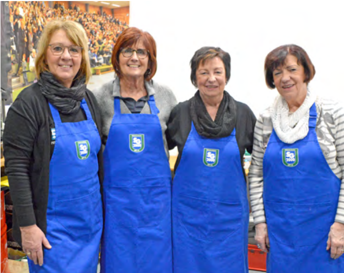
▲ Bei diesem Event sind die Helferinnen seit weit mehr als 20 Jahren tragende Säulen des Erfolges.