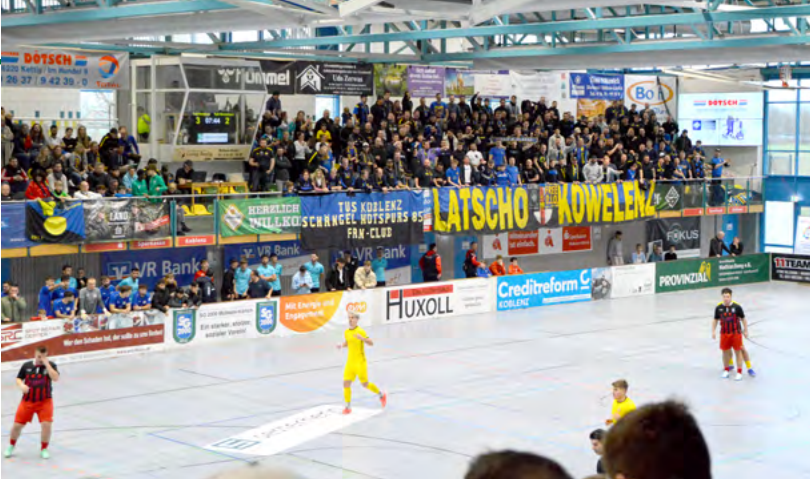
▲ Die Philipp-Heift-Halle war am Samstag bis auf den letzten Platz gefüllt. Darüber hinaus verfolgten mehrere Tausend Menschen das Turniergeschehen von zu Hause oder on the road im Livestream.