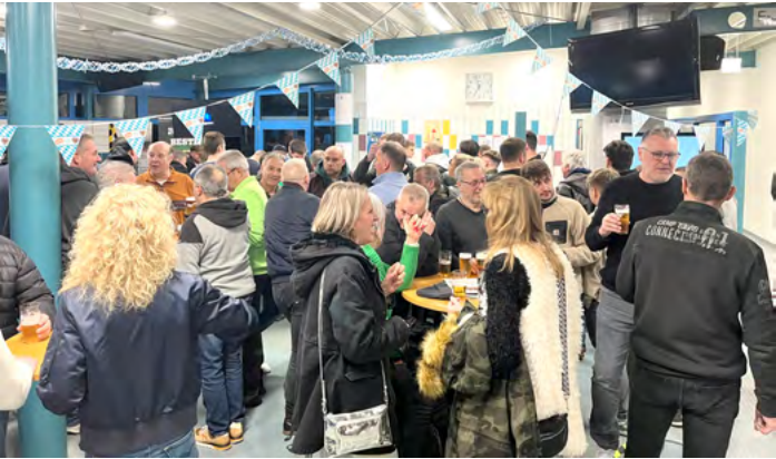
▲ Schon zu Turnierbeginn am frühen Freitagabend, war das Foyer der Philipp-Heift-Halle prall gefüllt.