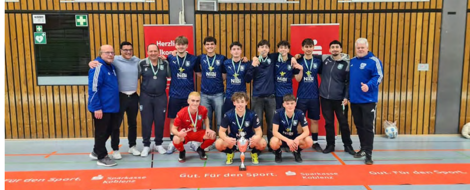
Unsere A-Jugend holte den Pott im Futsal-Kreisfinale

Die Teilnahme an der Hallenrunde brachte für unsere Jugendteams wertvolle Spiele und spannende Wettkämpfe mit sich. In verschie-